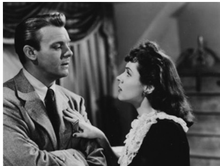
1941 WEEK-END À TROIS (Weekend for three) d'Irving Reis avec Dennis O'Keefe