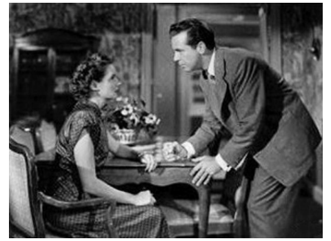
1948 SANGLANTE AVENTURE (Pitfall) d'Andre De Toth avec Dick Powell