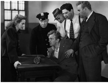
1946 BOOMERANG (Boomerang !) d'Elia Kazan avec Arthur Kennedy, Lee J. Cobb