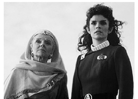
1986 STAR TREK IV, (Star Trek IV, the voyage home) de Leonard Nimoy avec Robin Curtis