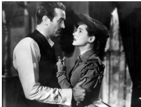
1950 AU FIL DE L'EAU (House by the River) de Fritz Lang avec Lee Bowman