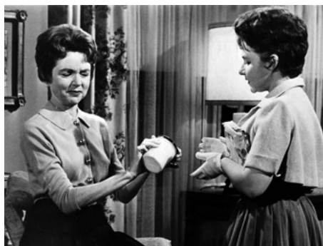
1961 THE TWO LITTLE BEARS de Randall Hood avec Brenda Lee