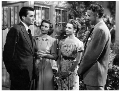
1947 LE MUR INVISIBLE (Gentleman's Agreement) d'Elia Kazan avec Gregory Peck, Dorothy McGuire