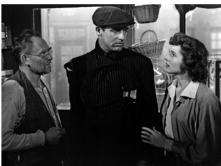
1944 RIEN QU'UN CŒUR SOLITAIRE (None but the lonely Heart) de Clifford Odets avec Cary Grant, Roman Bohnen