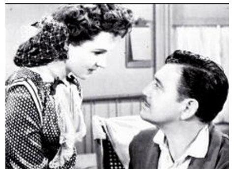
1943 LE CAVALIER DU KANSAS (The Kansan) de George Archaiinbaud avec Richard Dix