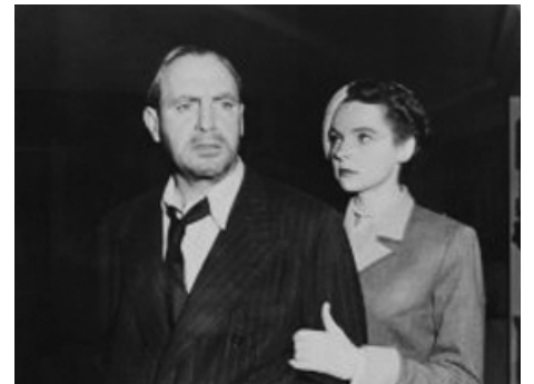
1951 CRIMINAL LAWYER de Seymour Friedman avec Pat O'Brien