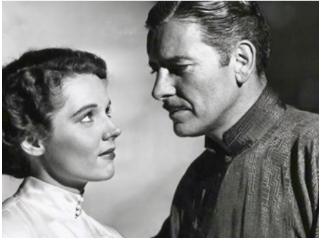
1935 HORIZONS PERDUS (Lost Horizon) de Frank Capra avec Ronald Colman