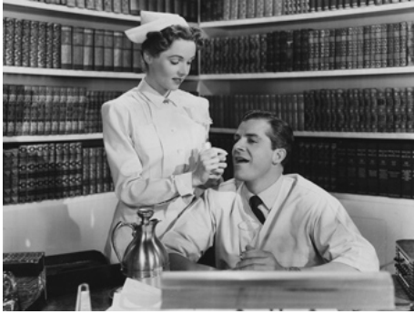
1948 LA VÉRITÉ NUE (No minor Vices) de Lewis Milestone avec Dana Andrews