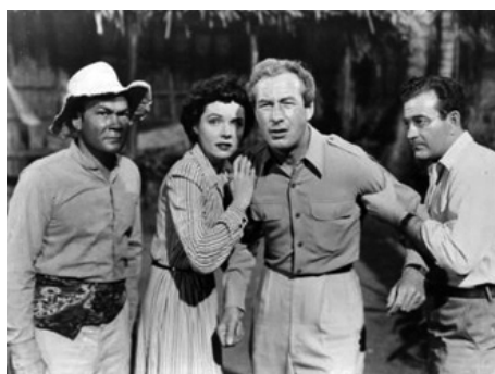
1946 STRANGE CONQUEST (Strange Conquest) de John Rawlins avec Lowell Gilmore