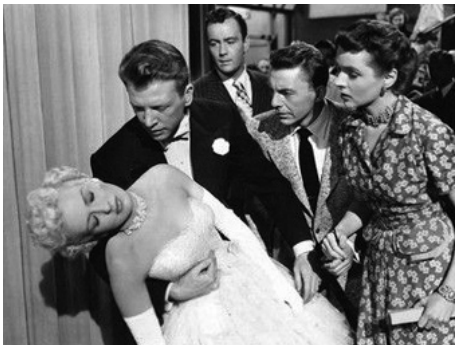
1950 TROIS GOSSÉS SUR LES BRAS (My blue Heaven) de H. Koster avec Betty Grable, D. Dailey, D. Wayne