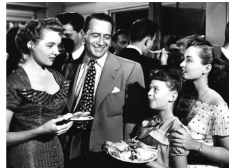
1950 CELLE DE NULLE PART (Our very Own) de D. Miller avec Donald Cook, N. Wood, Ann Blyth