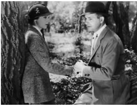
1934 ONE MORE RIVER de James Whale avec Frank Lawton