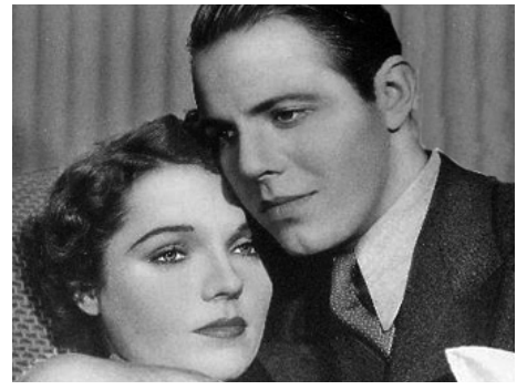
1935 À NEW YORK TOUS LES DEUX (The Luckiest Girl in the World) d'Edward Buzzell avec Louis Hayward