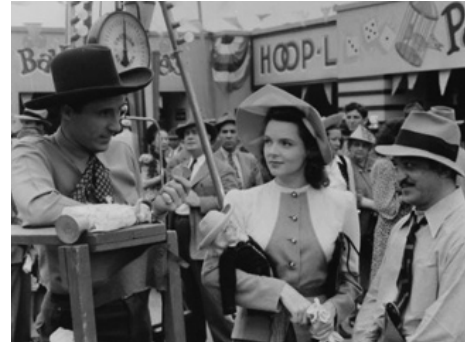
1941 HURRICANE SMITH (Double Identity) de Bernard Vorhaus avec Ray Middleton