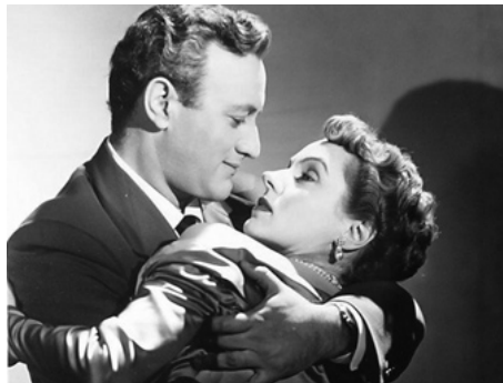
1950 THE MAN WHO CHEATED HIMSELF de Felix E. Feist avec Lee J. Cobb