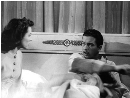
1941 KISSES FOR BREAKFAST de Lewis Seiler avec Dennis Morgan