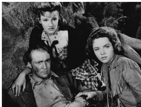
1943 LA VALLÉE INFERNALE (Buckskin Frontier) de Lesley Selander avec Lola Lane, Albert Dekker