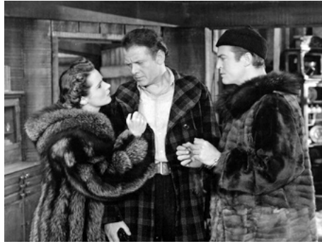
1940 GIRL FROM GOD'S COUNTRY de Sidney Salkow avec Chester Morris, Charles Bickford