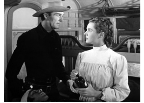
1949 CANADIAN PACIFIC (Canadian Pacific) d'Edwin L. Marin avec Randolph Scott