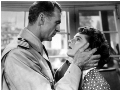
1949 HORIZONS EN FLAMME (Task Force) de Delmer Daves avec Gary Cooper