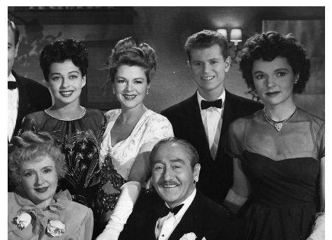
1946 4 FILLES CHERCHENT UN MARI (The Bachelor's Daughters) d'A. Stone avec A. Menjou, A. Dvorak