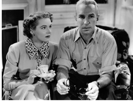
1948 GARÇONS EN CAGE (Bad Boy) de Kurt Neumann avec Lloyd Nolan